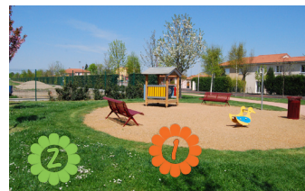
Rond-point du bateau