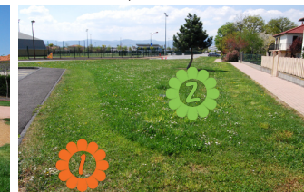
Zone piétonnière - Ronzières